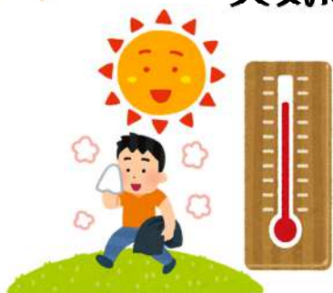
晴れて気温が高い日