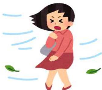
空気が乾燥して 風が強い日